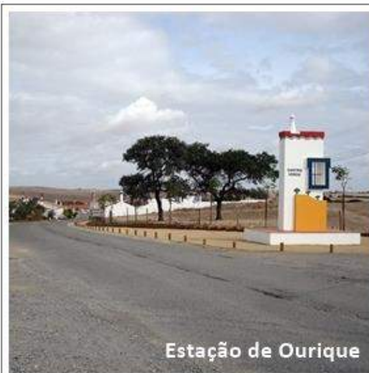
Estação de Ourique